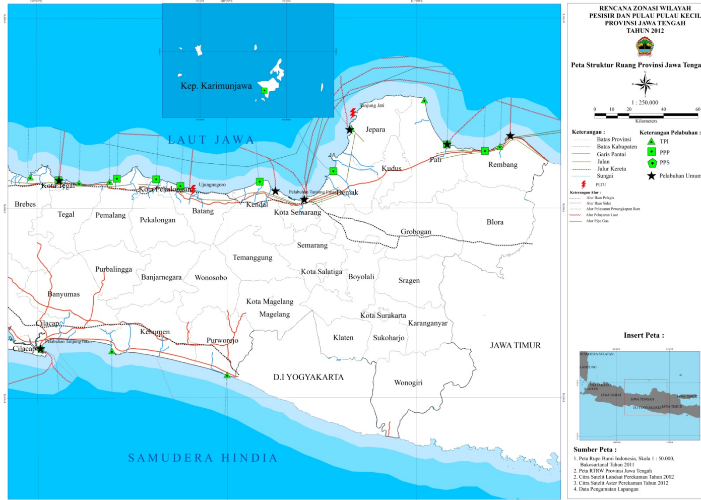
Lampiran 1. Peta Struktur Ruang RZWP3K Provinsi Jawa Tengah