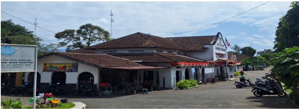
Gambar 2. Gedung Kantor Dinas Kependudukan dan Catatan Sipil Kabupaten Magelang dilihat dari tenggara.